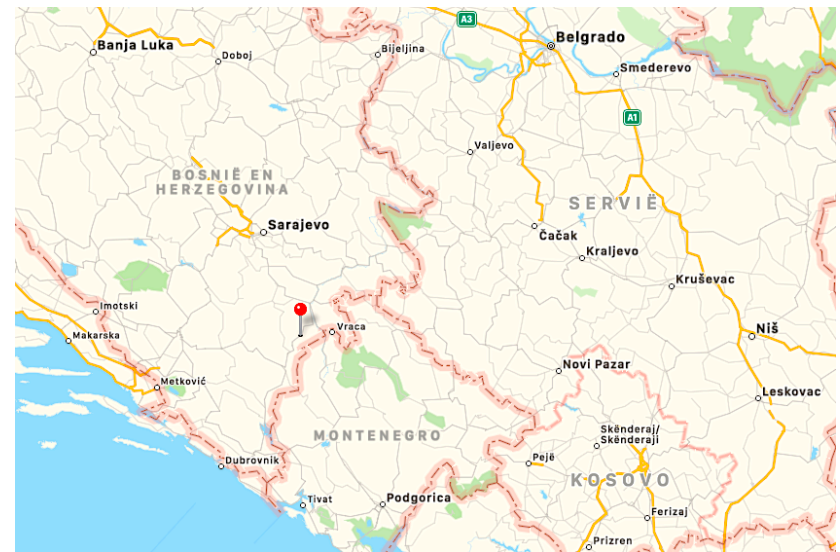
De rode speld markeert NP Sutjeska

Welkom dus, middenin de Balkan, ten Zuiden van Sarajevo, tegen de grens met Montenegro. Bij deze grens vloeit het park over in Nationaal Park Piva wat onder de Montenegrijnse jurisdictie valt. Deze grens steken we tijdens de outdoorreis een paar keer over omdat daar het Trnovačko meer ligt: een van de mooiste bergmeren van de omstreken.