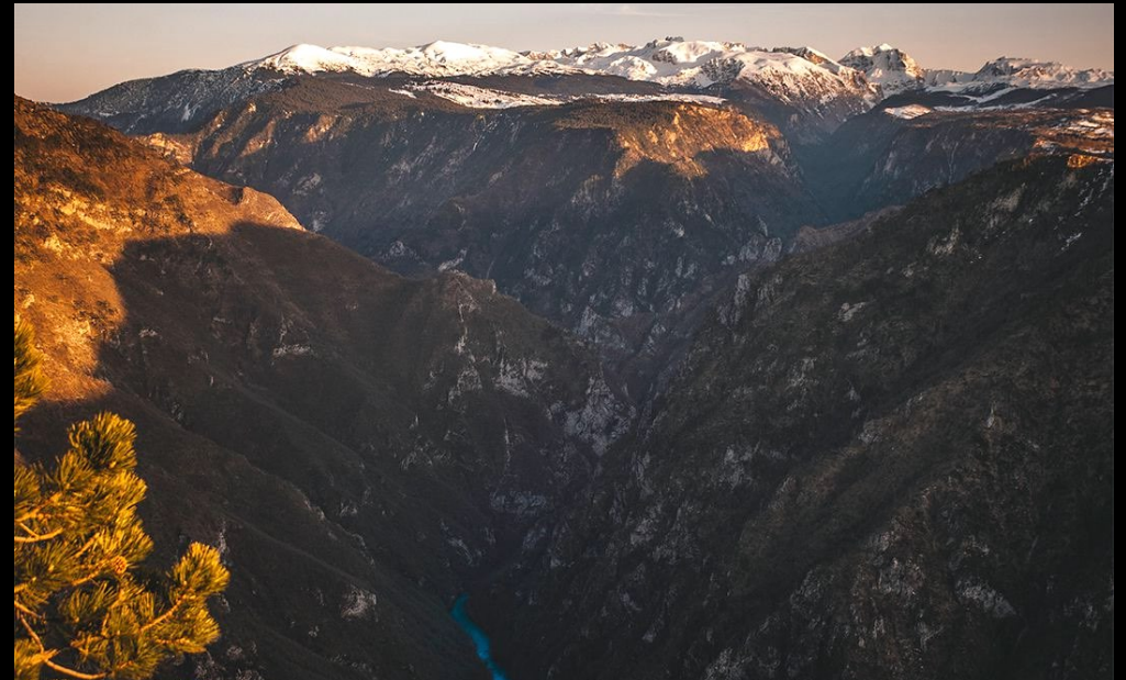
De Tara canyon is de op één na diepste canyon ter wereld

Vervolgens zakken we 1100m af door berenterritorium naar de weg langs de Sutjeska rivier om een stevige lunch te pakken in restaurant Komlen. We hebben er dan zo'n tien kilometer opzitten en kunnen wel een goede maaltijd gebruiken voor de rest van de dag.