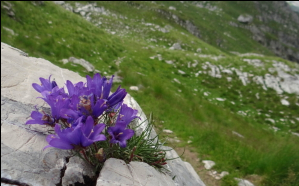
Edranianthus Sutjeskae ( Sutjeska's Rockbell )