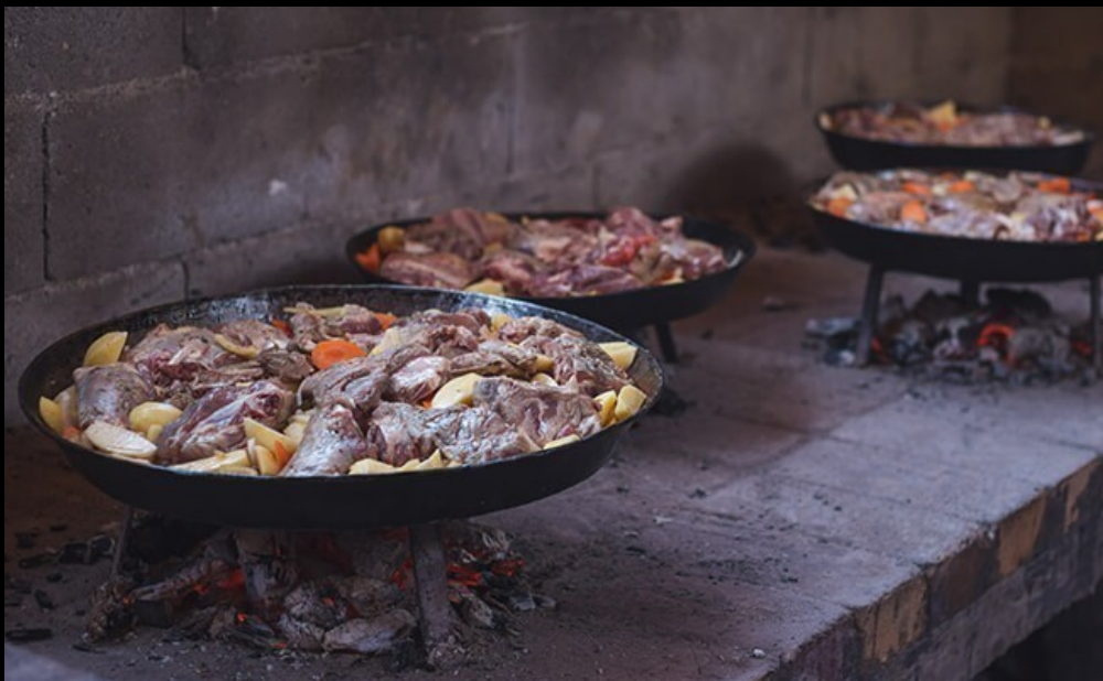
Traditionele gerechten bij de Drina-Tara Rafting Club

Afhankelijk van de tijd van het jaar verschilt het waterpeil van de Tara rivier. De tocht kan van 3 tot 6 uur duren, inclusief pauzes om foto's te maken en in het water te springen, en eindigt op de plaats waar de Tara en de Piva rivieren al zijn samengevloeid en samen de Drina vormen.