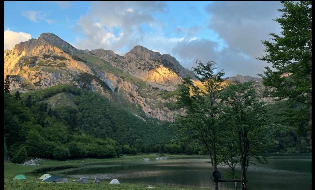
Tegen zonsondergang bij het kamp aan het Trnovačko meer

Ontbijt in het hotel zit inbegrepen. Sommigen blijven nog even, anderen reizen terug of door. Lees hierna meer over het collectief vervoer terug naar luchthaven Sarajevo.