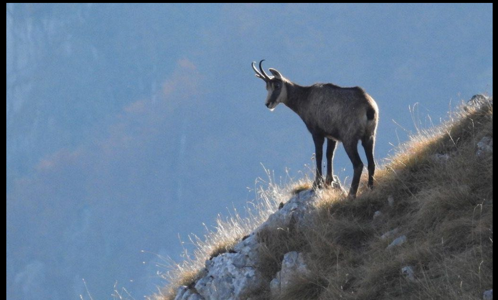
Een gems op de uitkijk