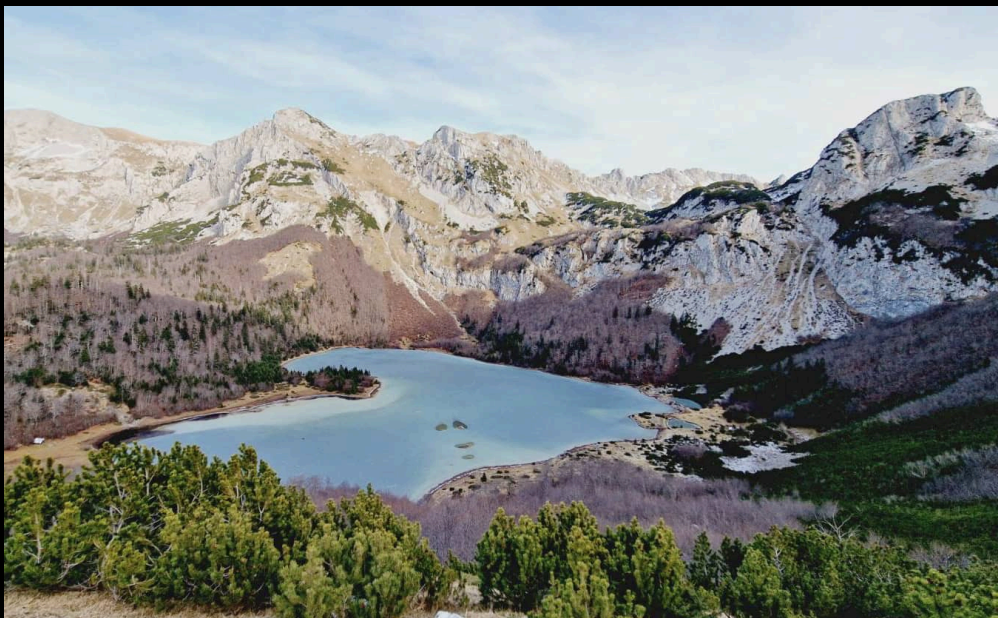
Het hartvormige Trnovačko meer vlak voor de lente

Na de lunch laden we onszelf met alle bepakking in een combi of meerdere jeeps en rijden naar Prijedor. Een mooie weidse plek onder de hoogste berg van Bosnië: Maglić (2386m).