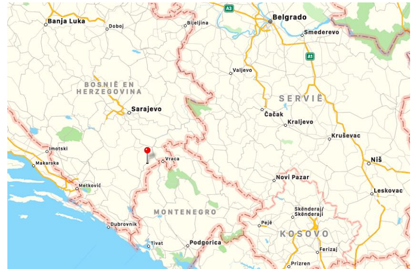
De rode speld markeert NP Sutjeska

Welkom dus, middenin de Balkan, ten Zuiden van Sarajevo, tegen de grens met Montenegro. Bij deze grens vloeit het park over in Nationaal Park Piva wat onder de Montenegrijnse jurisdictie valt. Deze grens steken we tijdens de outdoorreis een paar keer over omdat daar het Trnovačko meer ligt: een van de mooiste bergmeren van de omstreken.