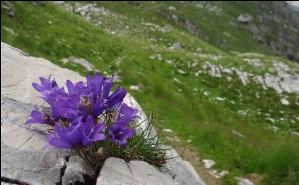
Edranianthus Sutjeskae ( Sutjeska's Rockbell )