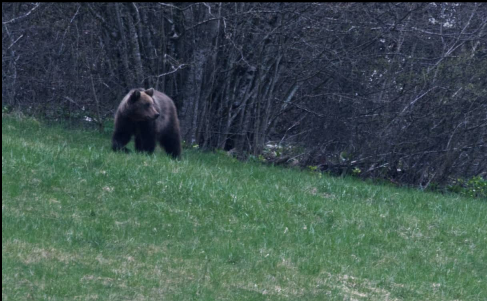
Bruine beer gefotografeerd tijdens een Outdoor Heroes reis begin april