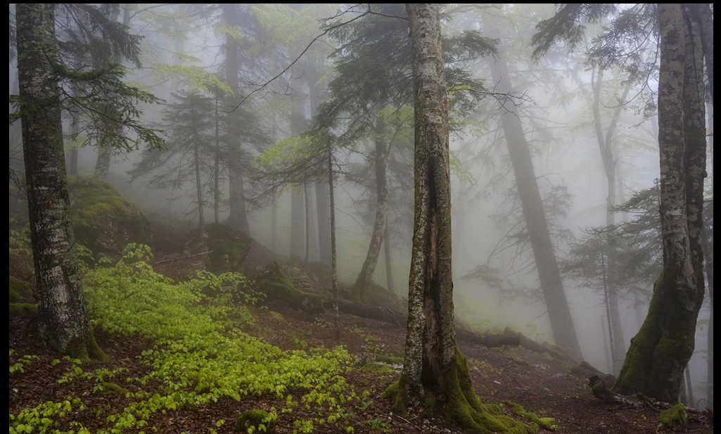
Mist in het Oerbos Perućica