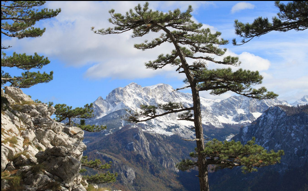
In de verte berg Maglić op de grens met Montenegro