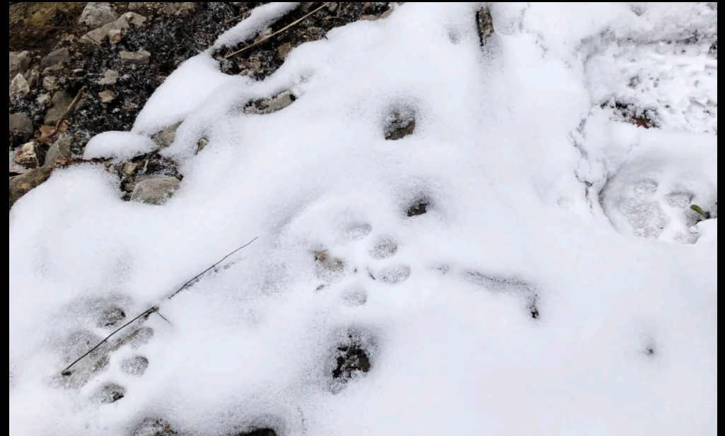
Sporen van vermoedelijk de Lynx

Je kan gerust zeggen dat het een divers, indrukwekkend, zelfs adembenemend gebied is, met voor ieder wat wils. Van vogel-tot wildspotter, visser, watersporter en bergwandelaar. Een perfecte locatie voor een outdoorreis!