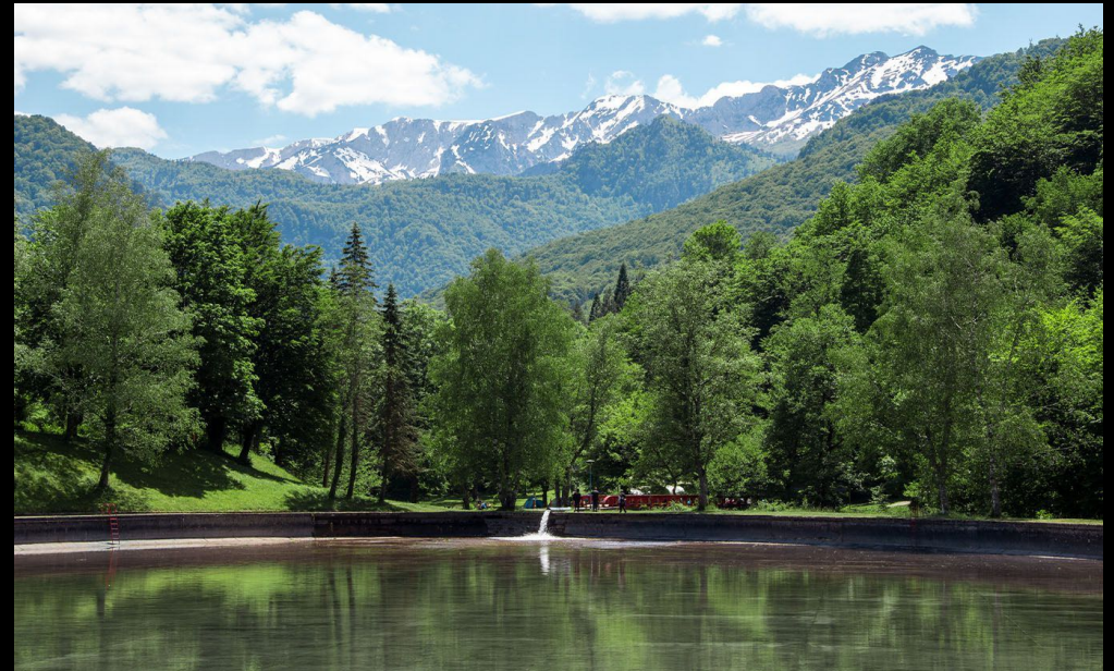
Het zomerbassin bij het Omladinski Kamp wordt gevuld in juni

Samen met het Omladinski Kamp en een aantal andere etablissementen, wordt hotel Mladost uitgebaat door de organisatie van het Nationale Park. Gebruik maken van hun diensten ondersteunt dus ook het natuurgebied.