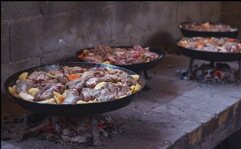
Traditionele gerechten bij de Drina-Tara Rafting Club

Afhankelijk van de tijd van het jaar verschilt het waterpeil van de Tara rivier. De tocht kan van 3 tot 6 uur duren, inclusief pauzes om foto's te maken en in het water te springen, en eindigt op de plaats waar de Tara en de Piva rivieren al zijn samengevloeid en samen de Drina vormen.