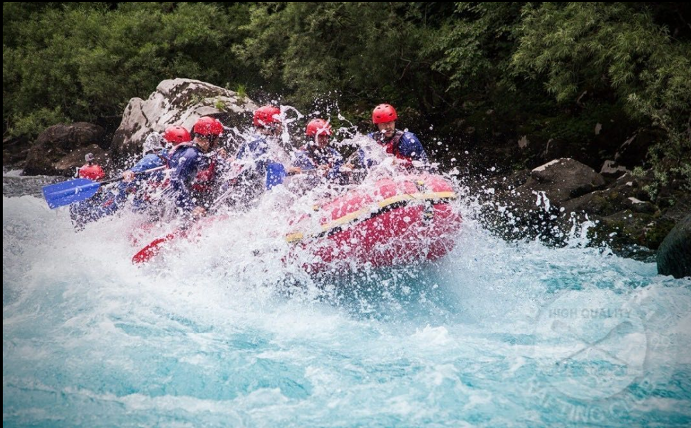
Rafting met de Drina-Tara Rafting Club