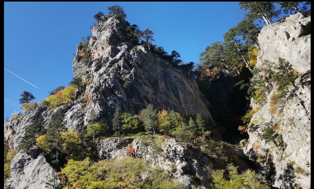
Ruige rotspartijen in Nationaal Park Sutjeska